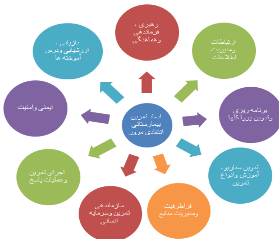
شکل-۱. ابعاد استخراج شده تمرین زیستی

مقالات نهایی استخراج شده به ترتیب از سال ۲۰۱۰ تا سال ۲۰۲۲ در نرم افزار MAXQDA نسخه ۱۸ وارد گردید. هر پاراگراف مقاله با دقت مطالعه و قسمتی که دارای مفهوم بود به آن کد داده شد. در نهایت ۱۷۵۸ کد از مقالات استخراج گردید (جدول ۲). کدهای استخراج شده به رویت تیم پژوهش که خود از افراد صاحب‌نظر و با تجربه درحوزه زیستی هستند، قرار گرفت. با کمک