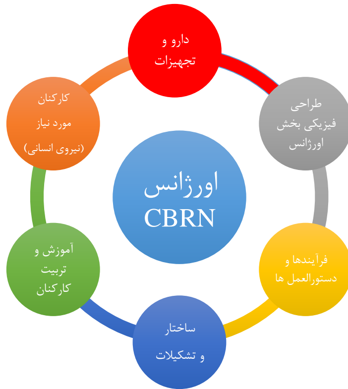
شکل-۲. الگوی اورژانس CBRN

تهویه شود. هنگامی که تعداد زیادی بیمار وجود دارد، بهتر است در فضای باز تحت درمان قرار گیرند (۱۲). جهانگیری و همکاران، نقش مهمی برای فضای فیزیکی بیمارستان به هنگام آمادگی در برابر حوادث CBRN (پرتوی و هسته‌ای) قائل شده و بیان می‌دارند که پژوهش‌های بین‌المللی بر ضرورت آمادگی فیزیکی بیمارستان‌ها در برابر حوادث انسان ساخت تأکید فراوان داشته‌اند. از این رو علی‌رغم هزینه‌های بالای آماده نمودن فضای فیزیکی برای بیمارستان‌ها، اولویت‌بندی و تخصیص بودجه به این امور باید در رأس موارد دیگر قرار گرفته و ارزیابی شود. اما تاکنون متصدیان امر بر فضای فیزیکی در برابر حوادث غیرمترقبه تمرکز نکرده‌اند. داوری نیز بر این نکته تأکید می‌کند که طراحی بیمارستان‌های مربوط به درمان مصدومین هسته‌ای، نسبت به بیمارستان‌های دیگر مقداری متفاوت است و این مراکز دارای قسمتی خاص جهت نصب وسایل آلودگی‌زدایی و سیستم فاضلاب جدا برای ذخیره آب آلوده می‌باشند (۱۴).