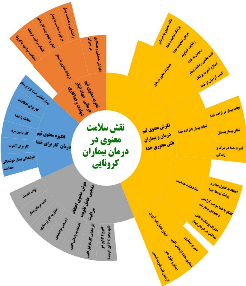
شکل-۲. چارت انفجار خورشیدی حاصل از کدگذاری محوری و انتخابی

یافته‌های مطالعه عبدالرحیمی و همکاران درباره تأثیر هوش معنوی بر عملکرد حرفه‌ای (۲۴) و یافته‌های شریف‌نیا و همکاران درباره تأثیر هوش معنوی و سلامت معنوی بر کاهش اضطراب مرگ و افزایش آرامش بیماران (۲۵) و یافته‌های Emmons مبنی بر اینکه هوش معنوی با افزایش قدرت خودآگاهی انسان، موجب می‌شود تا افراد در برابر مشکلات و سختی‌های زندگی، تاب‌آوری بیشتری از خود نشان دهند، هم‌خوانی دارد (۲۶). هوش معنوی به کارکنان درمانی، بیماران و خانواده آن‌ها توان‌سازگاری با مشکلات و احساس آرامش می‌داد و آن‌ها را در مقابل پیشامدها، خوش‌بین و امیدوار نگه می‌داشت. این یافته‌ها با نتایج تحقیق معاضدیان و باقری که نشانگر تأثیر مثبت آموزش مهارت‌های معنوی بر تقویت نگرش بیماران به معنویت، کاهش ضربه‌های روانی و سازگاری‌های خانوادگی، عاطفی، اجتماعی و جسمانی در بیماران است، هم