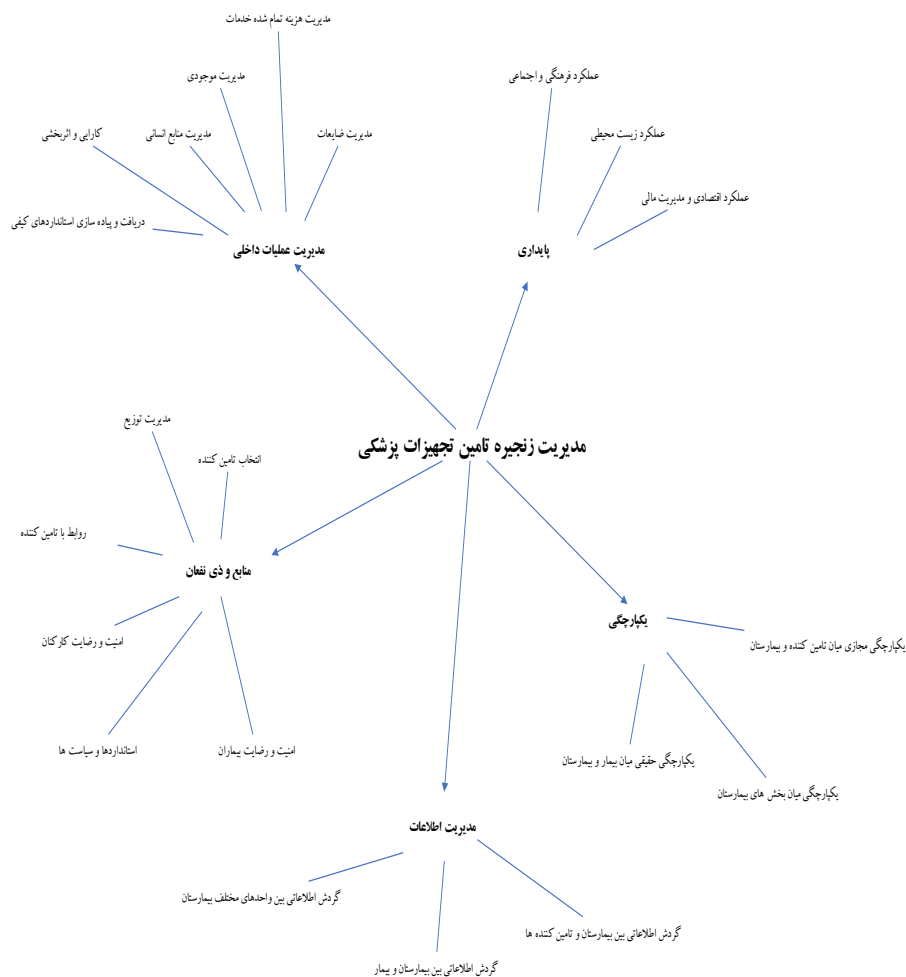
شکل- ۲. مدل جامع مدیریت زنجیره تامین تجهیزات پزشکی

پزشکی مورد مطالعه و همچنین متخصصین بیمارستانی (افرادی که مصاحبه شده بودند) پخش گردید. پس از تجزیه و تحلیل داده‌ها و روابط تحلیل سلسله مراتب فازی عنوان شده، نتایج وزن‌دهی شده معیارهای مدل بدست آمد. این نتایج در قالب جدول ۷ بیان شده است.