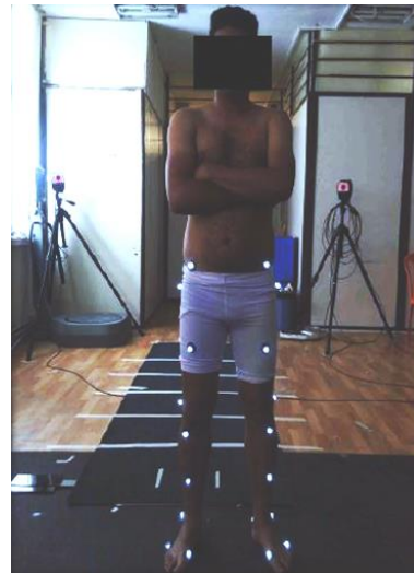
شکل-۱. محل قرارگیری مارکرها بر روی اندام پایین تنه (نمای قدامی)

از آزمون آماری تی وابسته جهت مقایسه هر پارامتر کینماتیکی بصورت جداگانه استفاده شد. سطح معنی داری P < 0.05 در نظر گرفته شد.