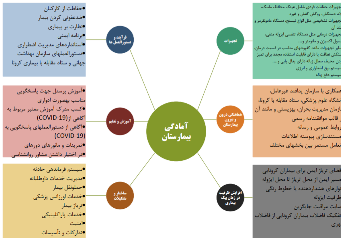
شکل-۱. الگوی آمادگی بیمارستان برای مقابله با بیماری کووید-۱۹ (۱۷)

که مدیران از طریق پرتال بیمارستان پرسشنامه‌ی طراحی شده را برای بخش‌های اورژانس، پرستاری، بخش مراقبت‌های ویژه ICU و پزشکان متخصص عفونت ارسال نمایند. بعد از ارسال پرسشنامه آنلاین به مدیران بیمارستان و تکمیل پرسشنامه از جانب آن‌ها اقدام به جمع‌آوری و تجزیه و تحلیل داده‌ها شد. شیوه امتیازبندی سؤالات به این صورت بود که سوالاتی که با (بله) پاسخ داده شده بود ۲ امتیاز منظور شد و برای سوالاتی که با (تا حدودی) پاسخ داده شده بود امتیاز ۱ و سوالاتی که با (خیر) پاسخ داده شده بود صفر امتیاز در نظر