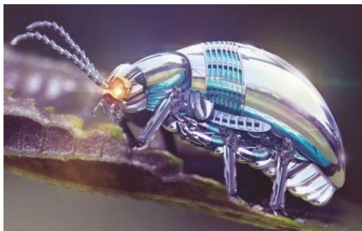
شکل-۳. حشره سایبری

حشرات سایبری (Cyber insects): یکی دیگر از پروژه‌های در حال اقدام، استفاده از حشرات برای استفاده جاسوسی از این موجودات است، در این پروژه، با استفاده از تکنولوژی نانو، ریزپردازنده‌ها و دوربین‌هایی همراه با جی پی اس، روی بدن حشرات قرار گرفته و این حشرات می‌توانند به صورت مستقیم عکس و فیلم را به مرکز کنترل ارسال کنند (۵۲). انرژی بکار رفته در این حشرات برای عکس و فیلمبرداری، با استفاده از تبدیل انرژی میکانیکی بال حشره به انرژی الکتریکی تأمین می‌شود. این پروژه به دو شکل استفاده از حشرات واقعی و حشرات مصنوعی انجام می‌شود. همچنین حشراتی شبیه پشه و مگس ساخته شده است که از کوچکترین روزنه اتاق می‌تواند وارد شود و بر شخص مورد هدف فرود آمده و همانند پشه که نیش خود را در بدن شخص فرو می‌کند، همان نیش را که حاوی سم است وارد بدن شخص می‌کند و فرد را از بین می‌برد (شکل-۳).