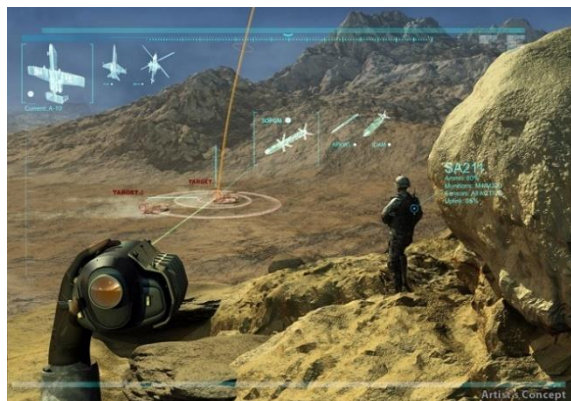
شکل-۴. سیستمی برای استقرار پشتیبانی فوری نزدیک هوایی (PIK-AS Project)

هوایی (PIK-AS Project): تاکتیک پشتیبانی نزدیک هوایی که در آن به سربازان دستور داده می شود تا از طریق حملات هوایی بتوانند در جریان درگیری های زمینی وارد شده و از فرصت استفاده کنند از زمان آغاز در جنگ جهانی اول تاکنون به طور نسبی بدون تغییر مانده است. در پشتیبانی نزدیک هوایی عادی، خلبان ها و نیروهای زمینی در یک لحظه از طریق نقشه مشترک بر یک هدف متمرکز می شوند. برنامه پایدار پشتیبانی نزدیک هوایی دارپا یا پیکاس با هدف تعریف مجدد و اساسی این مفهوم طراحی شده است. پیکاس می تواند نیروهای زمینی را قادر سازد تا بتوانند اطلاعات دقیق مکانی و تسلیحاتی مشترکی با نیروی مسلح هوایی داشته باشند. این مسئله هوایما را قادر می سازد تا بتواند به طور همزمان بر چند هدف تمرکز کند. پیکاس همچنین برای کاهش چشمگیر زمان بین حمله هوایی و ورود هوایما در میدان نبرد طراحی شده است (شکل-۴) (۵۸).