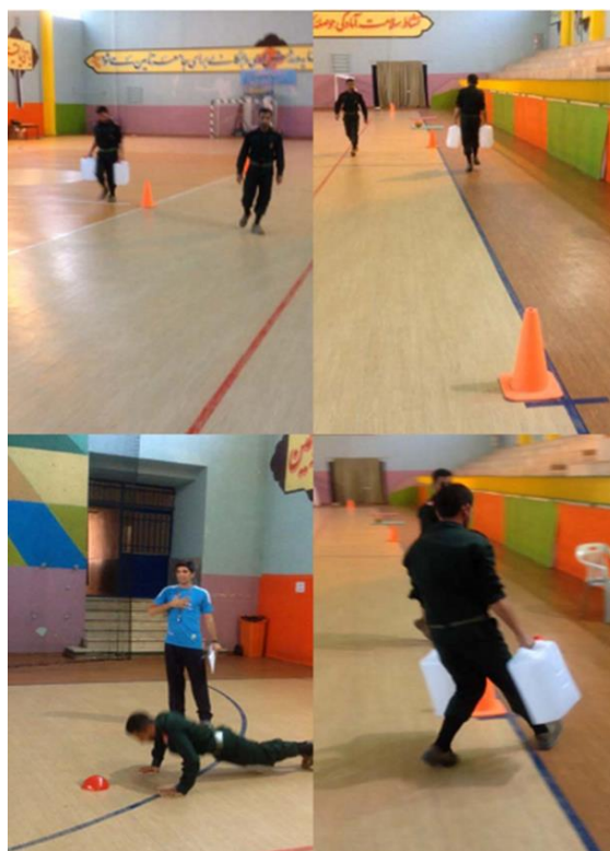
شکل-۲. اجرای تست MOB