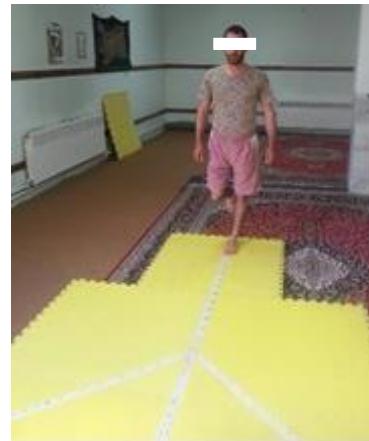
شکل-۲. نحوه اجرای آزمون سه جهش تک پا

نتایج آزمون لجستیک رگرسیون نشان داد که تکاورانی که نمره آزمون های عملکردی آن ها پایین تر از نقطه برش منحنی ROC است در معرض ریسک بالاتری برای آسیب دیدگی قرار داشتند. بدین ترتیب تکاورانی که نمره مجموع آزمون Y ( p=0/02 ) و میزان ریش در جهت خلفی-خارجی ( p=0/02 ) آنها پایین تر است به طور معنی داری در معرض ریسک بالاتر آسیب دیدگی بودند. بر اساس نتایج منحنی ROC و شاخص بودن نمره مجموع ۸۱/۵ به عنوان نقطه برش آزمون تعادل Y، تکاورانی که نمره مجموع آزمون Y آنها کمتر از ۸۱/۵ بوده است ۲/۲۵ برابر بیشتر نسبت به سایر تکاوران مستعد بروز آسیب اندام تحتانی هستند. برای نمره مجموع آزمون Y در نقطه برش ۸۱/۵، حساسیت برابر با ۰/۸۱ و ویژگی برابر با ۰/۶۳ بود. اما رابطه پیش بین معنی داری بین میزان ریش در جهت قدامی ( p=0/62 ) و خلفی داخلی ( p=0/93 ) با وقوع آسیب های اندام تحتانی دیده نشد. همچنین در آزمون سه جهش تک پا، تکاورانی که مسافت طی شده آزمون سه جهش تک پای آن ها پایین تر از ۷۰٪ قدشان داشتند احتمال وقوع آسیب ۲/۳ برابر بیشتر بود (جدول ۲-). نقطه برش ۷۰٪ قد فرد در آزمون سه جهش تک پا، حساسیت برابر با ۰/۸۱ و ویژگی برابر با ۰/۶۳ را نشان داد.