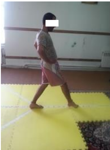
شکل-۱. آزمودنی حین اجرای آزمون Y

بین آزمون گر برای نمره کل به ترتیب ۰/۹۱ و ۰/۹۹ توسط Plisky گزارش شده است (۲۱). در این آزمون سه جهت (قدامی، خلفی-داخلی و خلفی-خارجی) به صورت Y و با زوایای ۱۳۵، ۱۳۵ و ۹۰ درجه نسبت به هم قرار می گیرند. بمنظور به حداقل رساندن اثرات یادگیری هر آزمودنی ۶ بار آزمون را در جهت های سه گانه تمرین می کند تا روش اجرای آن را فرا گیرد (آزمودنی با پای برتر راست آزمون را در خلاف جهت عقربه های ساعت انجام می دهد و آزمودنی با پای برتر چپ آزمون را در جهت عقربه های ساعت انجام می دهد). برای اجرای آزمون، آزمودنی با پای برتر در مرکز جهات می ایستاد و با پای دیگر عمل دستیابی را تا آنجا که خطا نکند (پا از مرکز جهات حرکت نکند، روی پایی که عمل دستیابی را انجام می دهد تکیه نکند یا آزمودنی نیفتد) انجام می داد و سپس به حالت طبیعی روی دو پا برمی گشت (شکل-۱). فاصله محل تماس تا مرکز، فاصله دست یابی است. آزمودنی سه بار آزمون را انجام می داد و آزمون گر میانگین دست یابی در هر یک از جهات را اندازه گیری کرده و بر طول پا (بر حسب سانتی متر) تقسیم و در ۱۰۰ ضرب می کرد تا فاصله دست یابی بر حسب درصد اندازه طول پا در هر یک از سه جهت به دست آید. از جمع اعداد به دست آمده و تقسیم آن به عدد سه امتیاز ترکیبی آزمودنی محاسبه شد (۲۱).