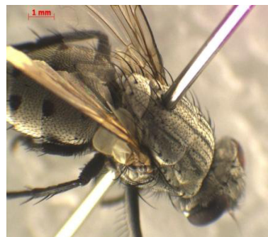
شکل ۵) ولفارسیا مگنیفیکای صید شده از جزایر (راست) (ژنیتالیا) و شکل آندگوس آن (چپ)