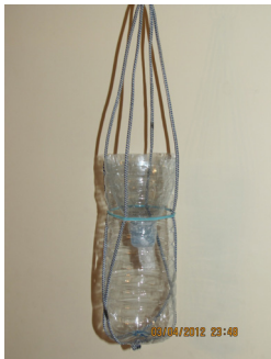
شکل ۳) تله بطری برای صید مگس حاوی طعمه گوشت برای جلب مگس