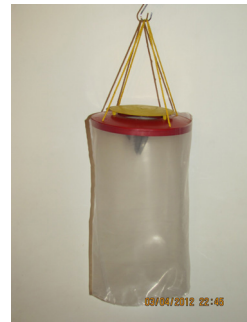
شکل ۲) تله صید مگس (تله سانتوز) حاوی طعمه پودر خون برای جلب مگس