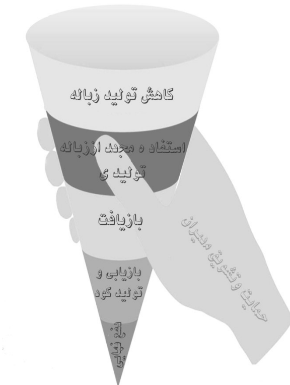
شکل ۱) هرم مدیریتی پسماندها با رویکرد کاهش تولید و بازیافت

امروزه هرم مدیریت پسماندها بر اساس شکل ۱ است. همان‌طور که مشاهده می‌شود، در ابتدا و اولویت اول کاهش تولید پسماند با بیشترین سطح پوششی نمودار، قرار دارد و امروزه پیشگیری از تولید پسماند در سطح جهان به شدت مورد توجه است و الگوی موفق و قابل‌اجرای حتی در بیمارستان‌ها، اداره‌ها و سازمان‌ها، صنایع و کارخانه‌ها و حتی در سطح شهرها است. این امر فقط با اصلاح الگوی مصرف مواد و تجهیزات و وسایل مورد نیاز در بیمارستان میسر خواهد شد. بعد از کاهش تولید پسماندها، به ترتیب جداسازی و تفکیک و استفاده مجدد از پسماندها، بازیافت و تهیه کود از پسماندها و اقدامات پیش تصفیه به‌منظور بی‌خطر سازی و در نهایت دفع هرآنچه که به‌عنوان پسماند و دورریز نهایی باقی مانده است، در اولویت قرار دارند [۱۴، ۱۳، ۱۰].