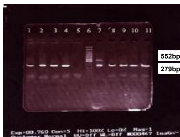
شکل ۱: نتیجه الکتروفورز واکنش Multiplex PCR با دو جفت پرایمر ویژه‌ی ژن‌های nuc و sea جهت شناسایی استافیلوکوکوس اورئوس انتروتوکسوژنیک تایپ A از ژنوم باکتری‌ها در ژل آگارز یک درصد.

شماره ۱۱: S. aureus Z95 (تهیه شده از دانشکده‌ی دامپزشکی دانشگاه تهران)