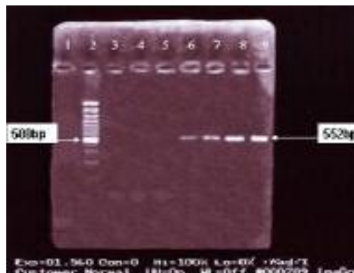
شکل ۳: نتایج PCR با تعداد متفاوت سلول در نمونه‌های مستقیم.

در ستون ۵، سالمونلا پاراتیفی A (NCTC=5702) در ستون ۷، یرسینیا سودوتوبرکلوزیس (PCTC=1070) در ستون ۸، اشریشیا کلی O111 (SLIR) در ستون ۹، پروتئوس ولگاریس سویه ox19 (ATCC=6380) در ستون ۱۰ و استافیلوکوکوس اورئوس Px2 (جداسازی شده از کشت ادرار بیمارستان فیروزآبادی) در ستون ۱۱ استفاده گردید که مورد آزمایش PCR با جفت پرایمر ویژه‌ی انتروتوکسین استافیلوکوکی تایپ A قرار گرفته بود. تنها سویه‌ی Px2 استافیلوکوکوس اورئوس قطعه‌ی ۵۵۲ جفت باز را ایجاد نمود (شکل ۴، ستون ۱۱). از نشانگر وزن مولکولی ۱۰۰bp نیز در ستون ۶ استفاده گردید.