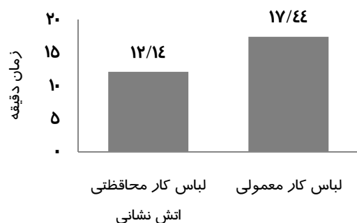
نمودار ۲) مقایسه زمان انجام فعالیت بدنی در لباس کار و لباس محافظتی آتش نشانی